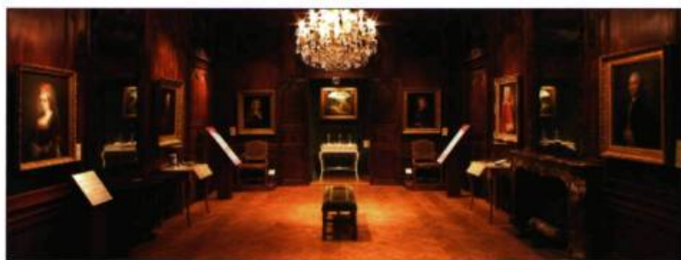
Les lambris de la salle de Nantes proviennent du bureau d'un directeur de la Compagnie des Indes, propriétaire du château à la fin du Régime français.

Château Ramezay le prouve. Au cours des dernières années, de nombreux travaux ont permis de restaurer l'édifice, de modifier certains de ses éléments, d'en préserver d'autres, et même d'aménager un jardin, qui n'est donc pas de 1705, mais bel et bien des années 1990 ! Ils s'inscrivent bien sûr dans une optique de conservation soucieuse de la continuité, mais aussi d'interprétation et d'éducation. La Déclaration de Québec rappelle d'ailleurs que l'esprit du lieu « est un processus construit et recons-