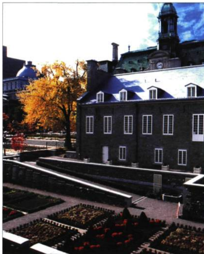
Le jardin du Gouverneur compte toutes les variétés courantes de plantes et d'arbres fruitiers qui étaient cultivées dans le jardin d'un dignitaire du XVIII e siècle.

Les participants du congrès d'ICOMOS, réunis l'automne dernier à Québec, ont bien exprimé cette vision de l'esprit du lieu dans la Déclaration de Québec. L'esprit du lieu, c'est tout ce qui « donne du sens, de la valeur, de l'émotion et du mystère au lieu ». Entre les murs du château, l'esprit du lieu conserve tout particulièrement la mémoire de la famille de Ramezay, pierre d'assise de l'histoire de cet édifice. « L'esprit construit le lieu et, en même temps, le lieu investit et structure l'esprit », lit-on encore dans la Déclaration de Québec. L'évolution du