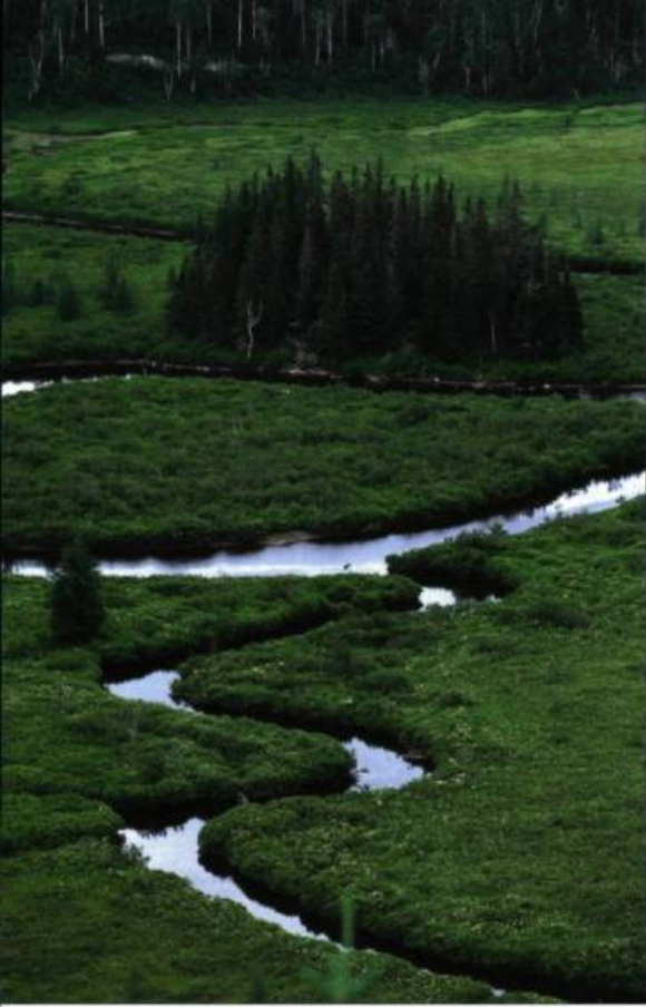
Vue des méandres sinueux de la rivière du Parc national des Monts-Valin.