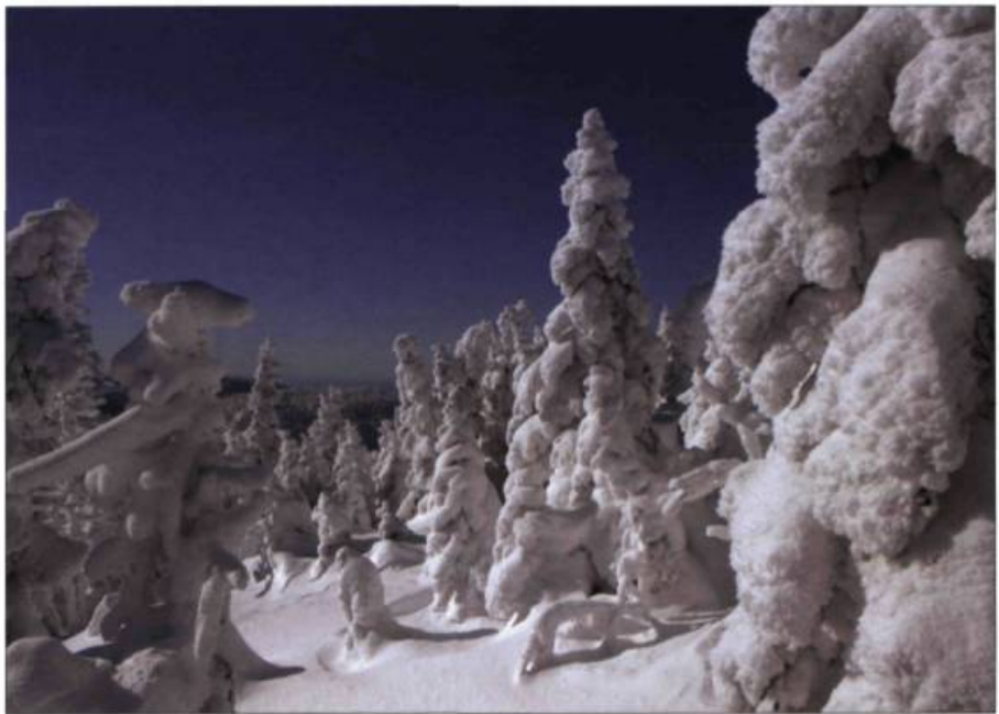
Paysage hivernal de la vallée des Fantômes au Parc national des Monts-Valin.