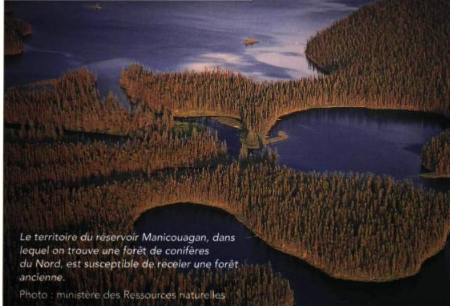
Le territoire du réservoir Manicouagan, dans lequel on trouve une forêt de conifères du Nord, est susceptible de receler une forêt ancienne.