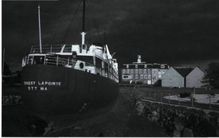
Le Musée maritime Bernier de l'Islet-sur-Mer présente de nombreux volets de l'histoire et du patrimoine maritimes du Québec.

créé un musée de la mer, là encore on a rapatrié un phare déplacé, là restauré un phare-auberge, ailleurs organisé un festival des chants de marins, et cette année enfin, une grande fête du Québec maritime. Mais il manque toujours une politique nationale du patrimoine, cohérente, horizontale et volontariste, capable d'entraîner l'adhésion de tous et de soutenir autant d'initiatives trop dispersées. Tandis que se poursuit, avec les moyens du bord, l'action nécessaire et exemplaire des Amis de la vallée du Saint-Laurent. Ne perdons pas espoir.