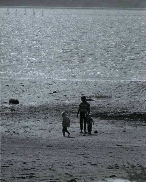
Petit à petit, les Québécois se sont réapproprié le fleuve et ses rivages.