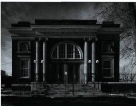
Le Douglas Memorial Hall.