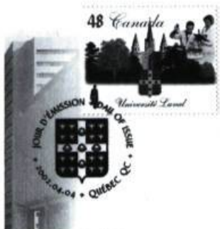
Timbre commémorant les 150 ans de l'Université Laval.

L'Université Laval est la toute première université francophone à avoir vu le jour en Amérique. Ses origines remontent à aussi loin que la fondation du Séminaire de Québec par M re François de Laval, en 1663. En 1852, l'institution obtenait sa charte et devenait la source de tout enseignement supérieur de langue française au Québec, au Canada et en Amérique. Ce double anniversaire, 340 ans et 150 ans, est célébré jusqu'en mai 2003. À l'occasion de ces festivités, un vibrant hommage au père Georges-Henri Lévesque s'est déroulé le 14 août dernier. L'influence sociale du père Lévesque, fondateur et premier doyen de la faculté des sciences sociales à l'Université Laval, est largement reconnue. Un monument, un livre hom-