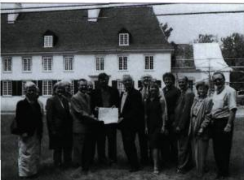
Les récipiendaires des prix et les intervenants de l'île d'Orléans.