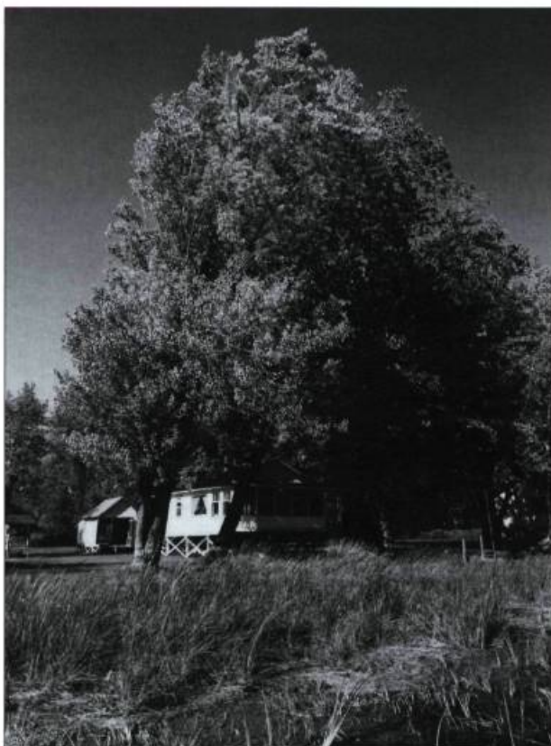
Chalets et maisons sur pilotis font partie du patrimoine local. C'est d'ailleurs sur l'Îlette au Pé que Germaine Guèvremont, l'auteure du Survenant, a passé les 11 derniers étés de sa vie.