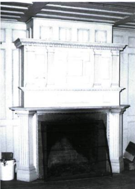
Illustration : Denis Désilet

et la partie supérieure du mur sera recouverte de plâtre peint, ce qui augmentera la luminosité de la pièce.