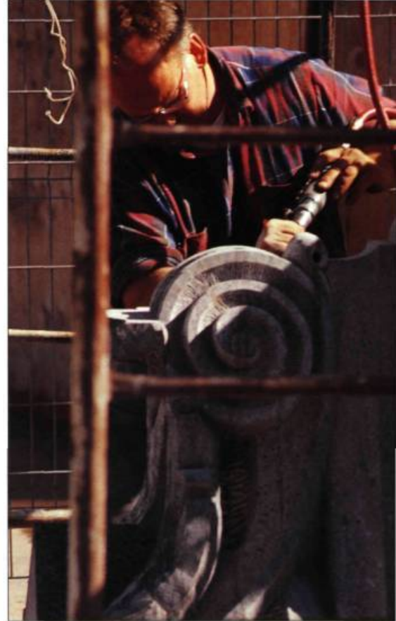
Plusieurs métiers traditionnels, dont la taille de la pierre, sont maintenant rares au Québec.