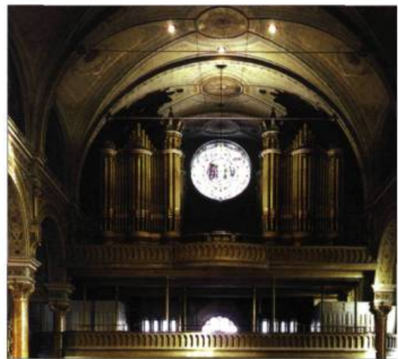
Objet d'une grande fierté locale, l'orgue Casavant de l'église du Très-Saint-Nom-de-Jésus a été restauré grâce à l'expertise de Casavant Frères et à l'implication de la population du quartier Hochelaga-Maisonneuve.