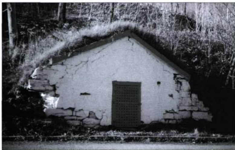
On retrouve une forte concentration de caveaux à légumes dans la partie est de la paroisse de Château-Richer, certains encore en utilisation.

bâtiment de pierre : le caveau à légumes, dont on n'apercevra quasiment que la façade. La terre, servant d'isolant, permettra une longue conservation de ces denrées. On ignore à quelle époque les habitants commencèrent à ériger ce type de bâtiments, dont on retrouve encore une forte concentration dans la partie est de la paroisse de Château-Richer, mais l'on sait qu'il y en avait déjà au début du XIX e siècle. 2