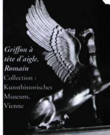
Griffon à tête d'aigle, Romain Collection : Kunsthistorisches Museum, Vienne

Le musée de la Civilisation présente, jusqu'au 2 octobre, la plus prestigieuse et la plus importante exposition jamais présentée depuis son ouverture : « Trésors des empereurs d'Autriche ». L'exposition propose une sélection de 330 magnifiques antiquités grecques et romaines autrefois détenues par les illustres César, Auguste, Tibère, Claude, Constantin, Julien et plusieurs autres. Il s'agit d'une expérience haute en couleur qui a été rendue possible grâce au musée Kunsthistorisches de Vienne. Certaines