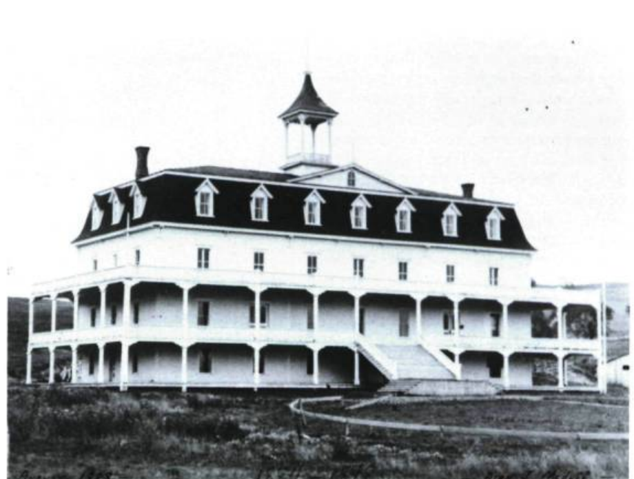
Hôtel New Camperdown.