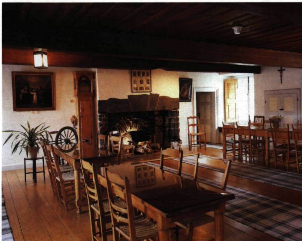
Dans la salle commune, à la fois réfectoire et salle de réception, les nombreux meubles de pin contribuent à créer une atmosphère chaleureuse où le temps semble s'être arrêté.

Place Dublin, à la Pointe-Saint-Charles, dans un environnement des plus urbains, s'élève un imposant bâtiment de pierres des champs noyées dans un épais mortier. Vestige d'une autre époque, la Maison Saint-Gabriel 1 est l'une des rares constructions qui témoignent de l'architecture montréalaise de la fin du XVII e siècle. Érigée vers 1668 par François LeBer et acquise peu de temps après par Marguerite Bourgeoys, fondatrice de la congrégation de Notre-Dame, cette maison de ferme, reconstruite en 1698 après un incendie, constitue aujourd'hui un site unique.