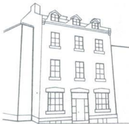
Dessin: Manon Fortin.

Certaines maisons seraient-elles bénies des dieux? Nul ne peut en douter après avoir visité cette belle demeure qui, en dépit des modes, a gardé son âme du XIX e siècle.