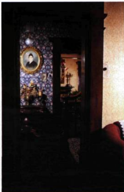
Le hall d'entrée vu du boudoir. On aperçoit tout au fond la salle à manger.

Bien que peu volumineux, cet escalier fait de bois de cerisier assure la noblesse des lieux. Ici, pas de surcharge de décor mais une recherche de formes harmonieuses.