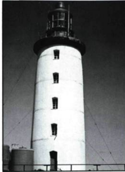
Phare de l'Île Bicquette (1844).

Aucun chantier maritime ancien n'a fait l'objet, jusqu'à maintenant, d'une publication sérieuse. À notre