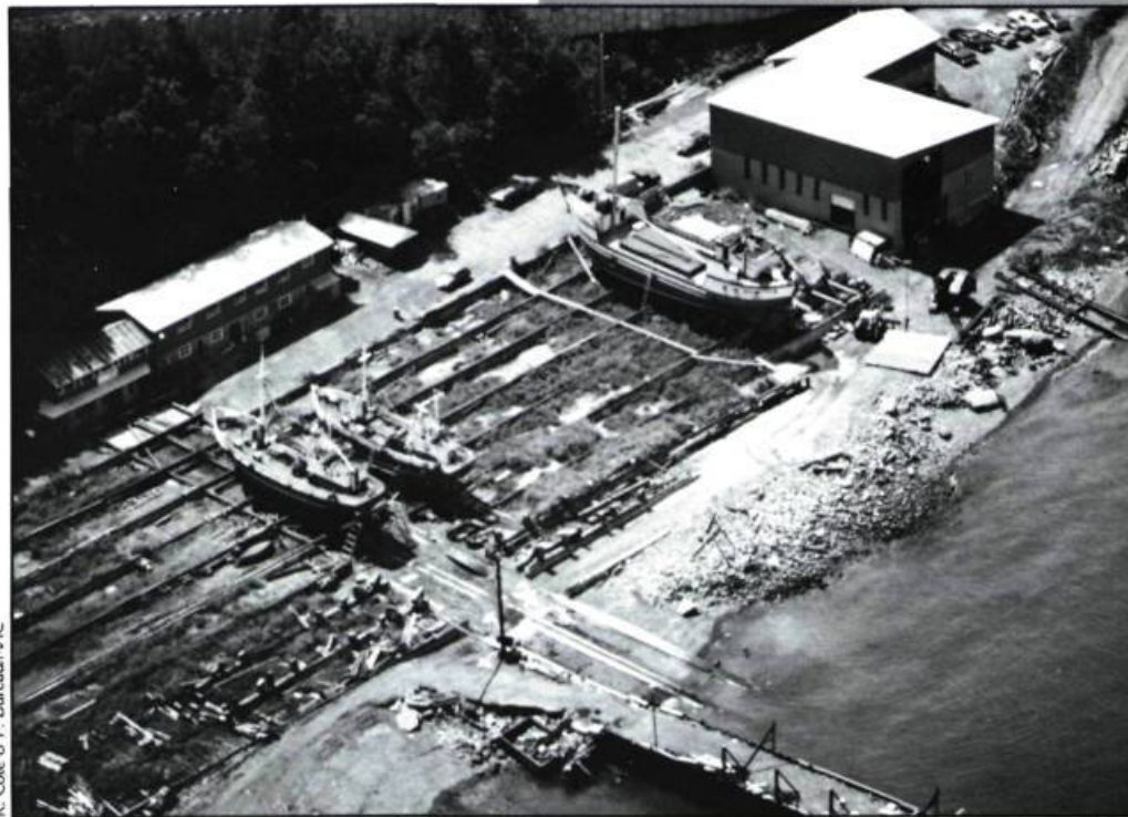
R. Côté & P. Bureau/MAC

Ceci étant dit, jetons un coup d'oeil sur les navires. L'absence de témoins visibles de la construction navale québécoise a longtemps freiné l'étude et l'analyse de l'architecture des navires construits sur les bords du Saint-Laurent. La redécouverte des enregistrements maritimes des principaux ports québécois a révélé l'importance quantitative de l'industrie. Au XIX e siècle, 1 635 navires construits au Québec sont enregistrés au port de la ville de Québec.