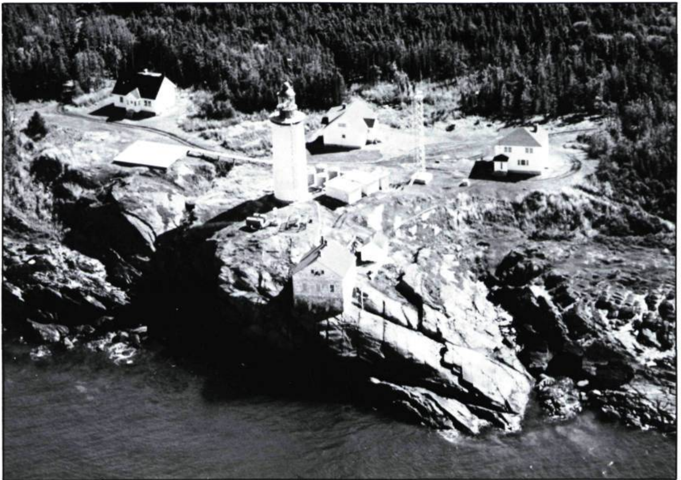
L'aide à la navigation... le phare de l'île Bicquette (1844).

Mais avant d'examiner les composantes terrestres de ce patrimoine, il convient de jeter un coup d'oeil sur certains éléments qui relient le bateau à la terre. Il y a bien sûr les aides à la navigation comme les phares et les bouées. Les phares s'élèvent, la plupart du temps, sur des hauts-fonds