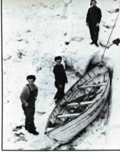
La traversée d'hiver à l'île-aux-Coudres, 1944-1945.

La question est de taille. Il y va de la pertinence d'une monumentale entreprise de conservation et de valorisation. Heureusement, toutefois, les raisons d'agir ne sont pas de moindre importance que les raisons justifiant l'inaction. Car celle-ci signifierait que l'on consent à abandonner à d'autres le rôle de maîtres d'oeuvre de nos exceptionnelles richesses marines.