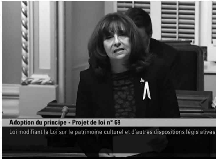
La ministre Nathalie Roy lors de l'adoption du principe du projet de loi 69. ( https://nathalieroy.org/2020/12/02/adoption-du-principe-du-projet-de-loi-69/ )