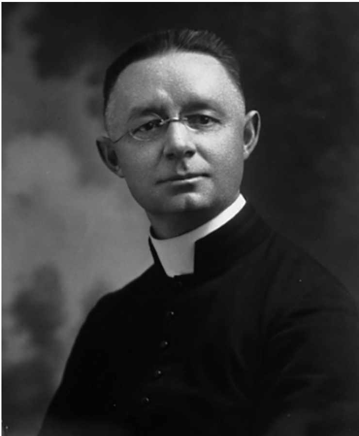
L'abbé Lionel Groulx. Être polarisant par ses idées et ses opinions, Lionel Groulx demeure une figure centrale dans l'institutionnalisation et l'organisation professionnelle de l'histoire au Québec. ( https://numerique.banq.qc.ca/patrimoine/details/52327/3107873?doc-searchtext=lionel%20groulx )

Il ne s'agit pas ici de faire état de l'œuvre de l'abbé Groulx et des débats qui la sous-tendent, mais bien de comprendre son rôle dans la disciplinarisation de l'histoire. En effet, il s'avère une figure incontournable de cette génération émergente