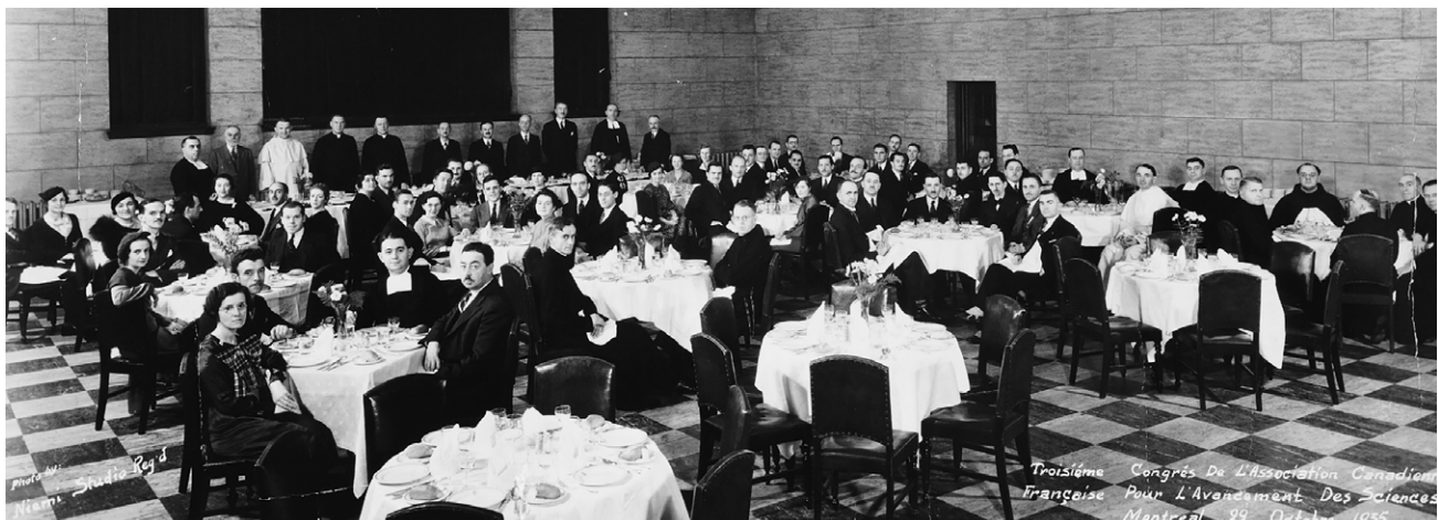
Souper du 3 e congrès de l'Acfas à Montréal, 1935.