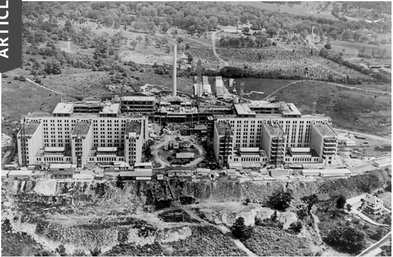
Chantier du nouveau pavillon de l'Université de Montréal, interrompu en 1931 et repris en 1941.