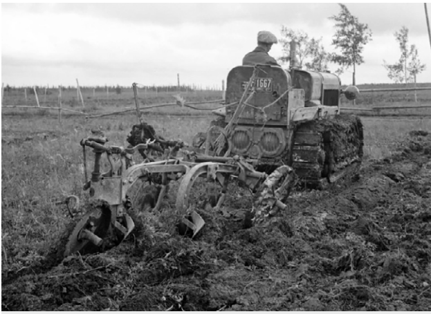
Labour mécanisé à l'aide d'un bulldozer sur le lot d'un colon, Abitibi.