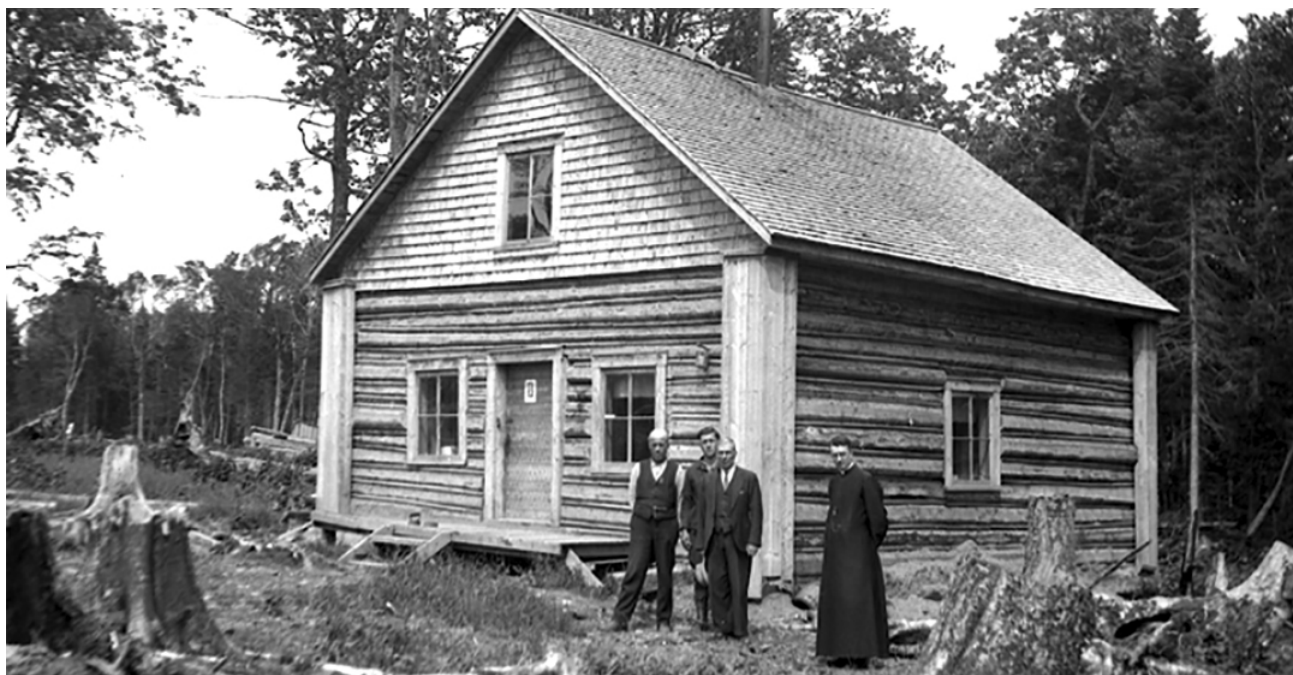
Maison de colon, canton Bédard. Photo : Eugène Gagné, 1935 (03Q, E6, S7, SS1, P2226). (BAnQ).

dépassées par le vaste programme de ruralisation qu'entreprend à son compte la province durant la décennie. Le célèbre plan Vautrin, en vigueur de l'automne 1934 au printemps 1937, favorise à lui seul le placement de près de 30 000 personnes, alors que d'autres programmes destinés aux fils de cultivateurs et aux journaliers des campagnes atteignent une popularité similaire. Au sortir de la crise, ce sont plus de 130 000 personnes qui ont bénéficié de ce vaste projet étatique de lutte contre le chômage et d'aménagement du territoire.