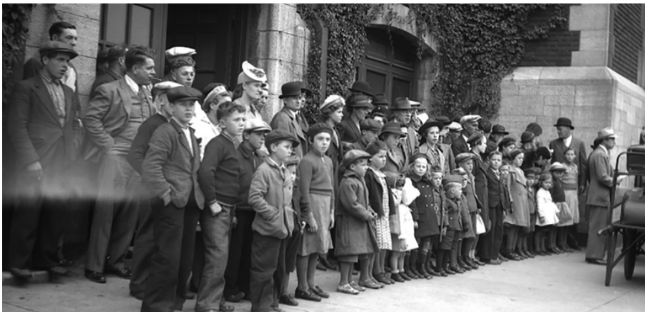
Madelinots de passage à Québec, en route pour l'île Nepawa.

Parmi de nombreux exemples, on trouve le cas de la réserve fédérale appartenant à la bande de Timiskaming et située dans le canton de Nédélec, au Témiscamingue. Seule réserve indienne dans toute la région, elle fait l'objet de pressions constantes durant la décennie. Pour le ministère québécois de la Colonisation et les municipalités avoisinantes, la réserve est jugée comme « nuisible au développement agricole, scolaire et commercial » du comté. Les autorités ont d'autres projets pour son développement : on souhaite y placer des chômeurs et construire une route de colonisation qui la traverserait. Entre juin 1937 et juin 1939, trois référendums de cession sont soumis à la bande, qui les rejette par une forte majorité. C'est finalement une campagne de séduction, menée par des politiciens locaux et l'agent du département des Affaires indiennes en juin 1939, et la proposition d'un montant de 30 000 $ en échange des terres qui auront raison de la résistance des Algonquins. Le 24 juin, un quatrième vote se tient. Cette fois, la cession est adoptée et plus de la moitié (8 500 acres sur 14 620) de cette réserve passe aux mains de la Couronne. « C'est avec joie, écrit le maire de Nédélec au département des Affaires indiennes quelques jours après le vote, que je viens sur celle-ci vous remercier sincèrement en mon nom et au nom de la paroisse du grand dévouement que vous avez apporté à notre cause qui est pour nous une question vitale, car l'obtention de cette réserve,