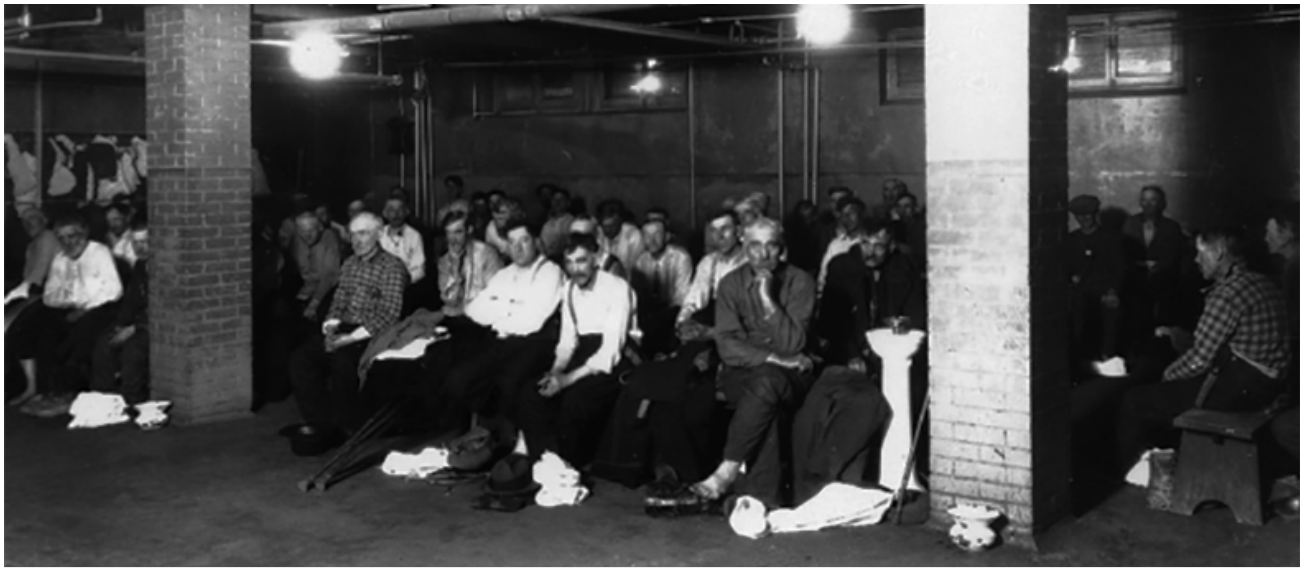
Chômeurs au refuge Meurling en 1933.