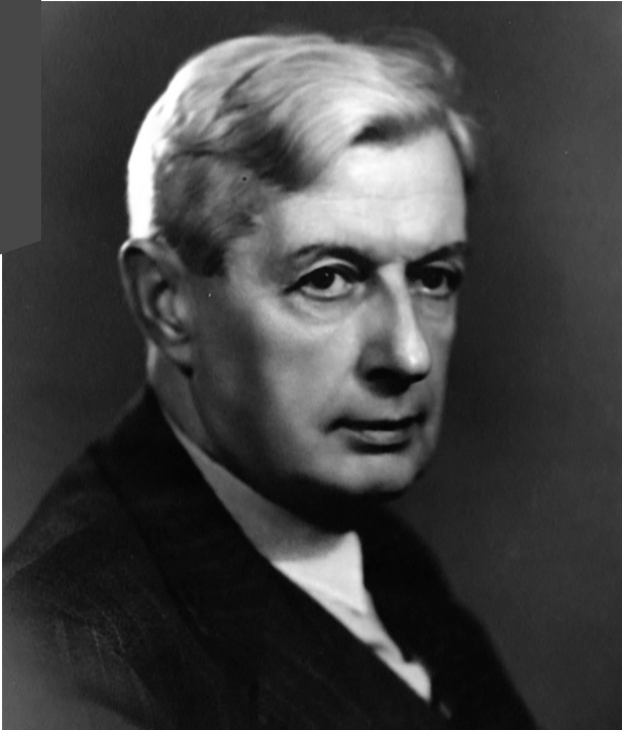
Édouard Montpetit (1881-1954). ( https://numerique.banq.qc.ca/patrimoine/details/52327/3287486?docsearchtext=edouard%20montpetit )

L'effondrement des cours boursiers, la fermeture des entreprises, la disparition des épargnes, la réduction des salaires et surtout, les pertes massives d'emploi sont à juste titre les premiers phénomènes qui sautent aux yeux lorsqu'on porte le regard sur la crise des années 1930.