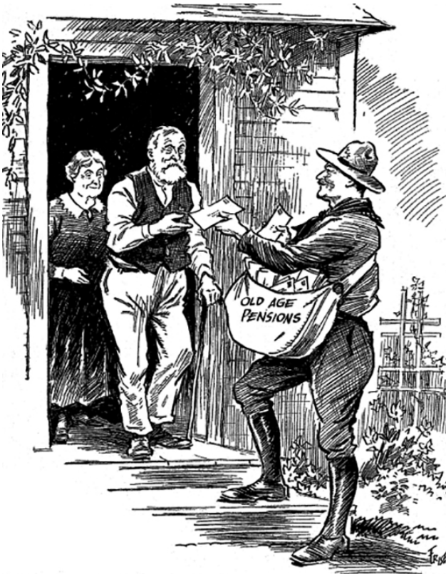
Affiche électorale du Parti libéral du Canada (1930). ( http://www.begbiecontestssociety.org/socialsecurity.htm )

immigrantes, qui sont parmi les plus vulnérables de la société. En 1937, près de 50 000 hommes et femmes au Québec obtiennent cette modeste pension de vieillesse, après s'être soumis à une procédure d'enquête humiliante sur leur état d'extrême pauvreté et sur l'incapacité de leurs enfants à pourvoir à leurs besoins. Cette humiliation est toutefois un moindre mal pour la plupart d'entre eux, puisqu'elle peut leur éviter celle du placement dans un hospice de l'assistance publique.