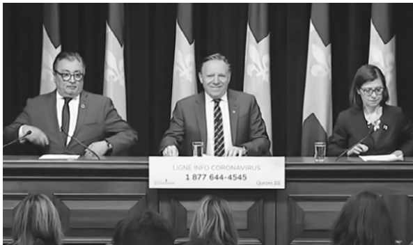
Un des points de presse du célèbre trio : François Legault, Danielle McCann, Horacio Arruda

Divers organismes, dont les musées et les bibliothèques publiques, ont répondu à la crise en maintenant les communications avec leurs usagers par Internet via les médias sociaux et les infolettres ou bulletins d'information. Plusieurs musées ont profité de l'occasion pour faire connaître leur contenu numérique et, dans certains cas, pour élargir leur offre. Les expositions virtuelles et les bases de données décrivant les collections sont autant de ressources en ligne qui ont permis aux institutions muséales de poursuivre leur mission en attendant de rouvrir leurs portes. Quant aux bibliothèques, elles ont misé elles aussi sur leurs collections numériques.