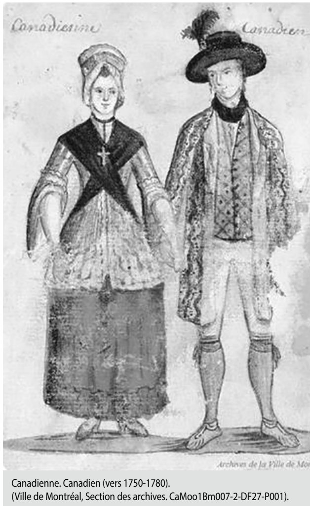
Canadienne. Canadien (vers 1750-1780).