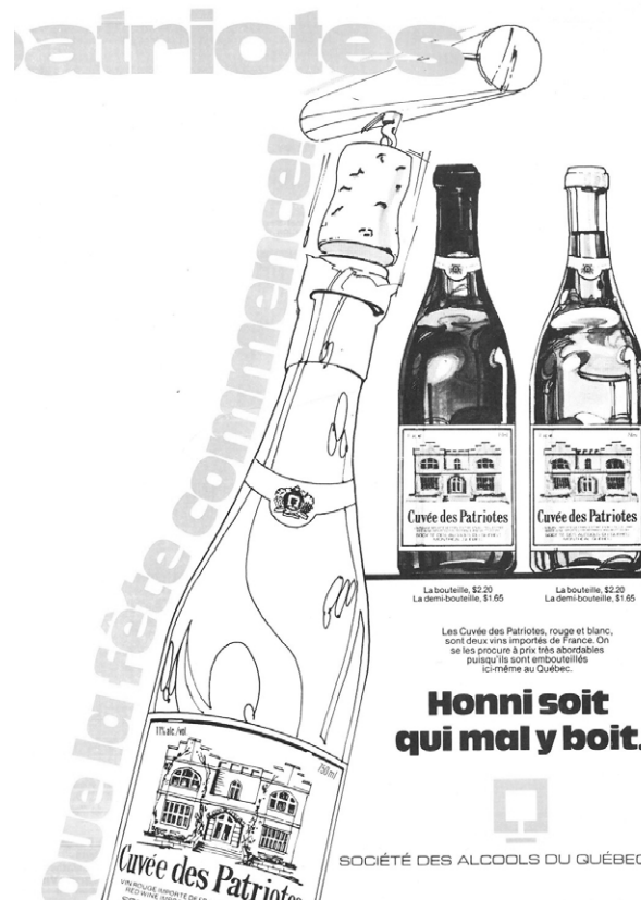
Une affiche pour souligner le lancement de la Cuvée des patriotes dans le cadre des festivités de la Saint-Jean-Baptiste et de la Semaine du patrimoine en 1976. Le slogan « Honni soit qui mal y boit » fera également l'objet d'une publicité télévisée. ( L'équipe , 3, 4, p. 5).