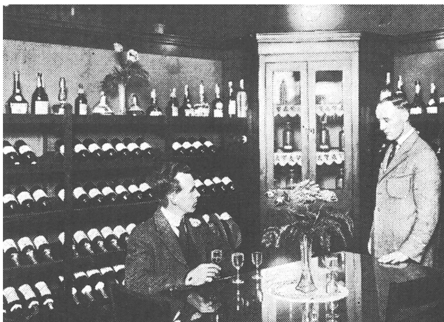
L'intérieur d'une des quatre boutiques réservées à la vente de vin de la Commission des liqueurs, dans lesquelles une certaine clientèle peut s'attabler confortablement pour déguster. ( L'histoire de l'alcool au Québec , 1986, p. 81).

Mais d'abord, un détour par la Commission des liqueurs où le vin a occupé une place particulière dès son institution en 1921. Puisque la bière domestique échappe à la tutelle gouvernementale, le vin est présenté comme une boisson phare pour mener à terme l'objectif social, ouvertement affiché dans le premier rapport annuel, de « transformation des habitudes d'un peuple ». La vente de spiritueux est ainsi limitée à une seule bouteille par visite jusqu'en 1941, tandis que le vin se dérobe à toute restriction. De plus, quatre succursales réservées