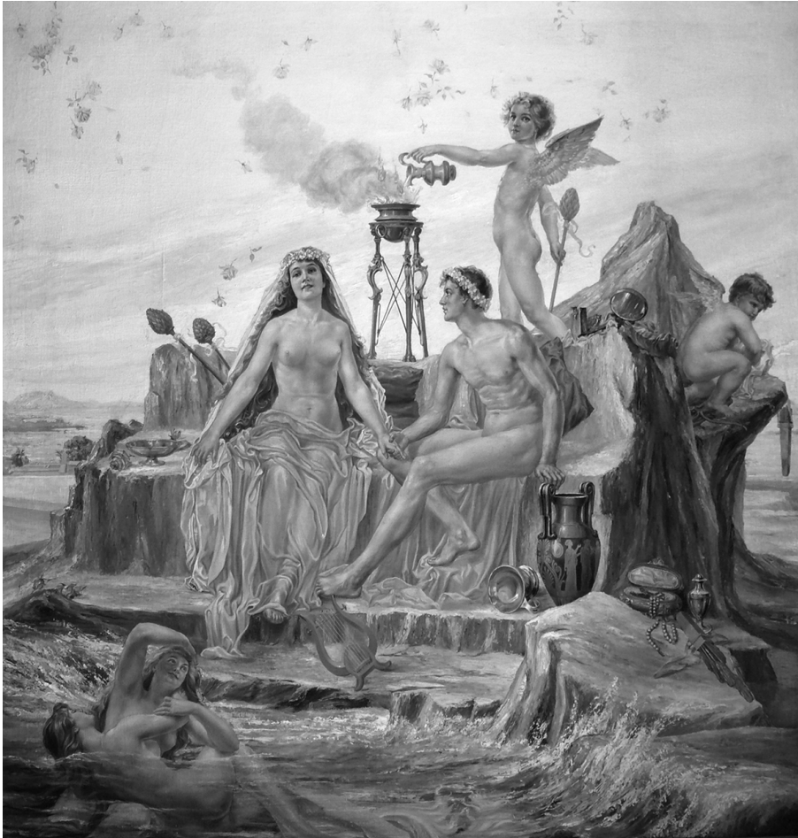
Le mariage d'Orphée et Eurydice, Grand Salon, Château Dufresne, Montréal. (© Roger Bocchini Nincheri).

comblant ainsi les besoins de prêtres plus traditionnels.