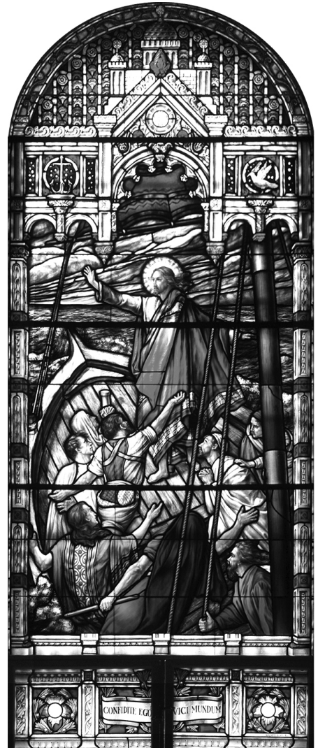
Jésus calmant la tempête, église Saint-Léon-de-Westmount, Westmount.