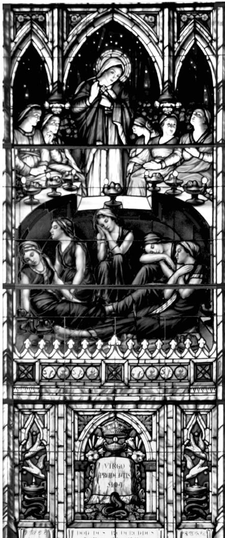
Virgo prudentissima, cathédrale de l'Assomption, Trois-Rivières.