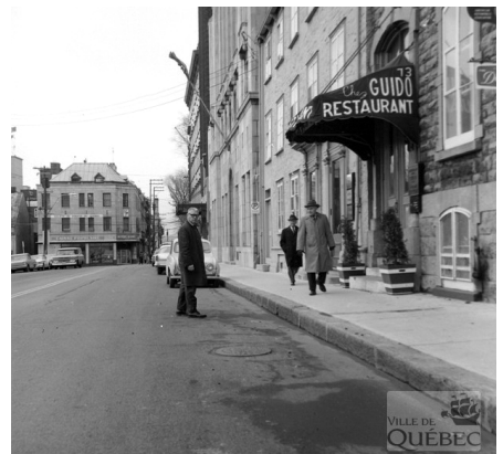
Restaurant Chez Guido, situé rue Sainte-Anne, entre les rues des Jardins et Chauveau (aujourd'hui rue Pierre-Olivier-Chauveau), dans le Vieux-Québec. On voit la caisse populaire Notre-Dame en arrière-plan.