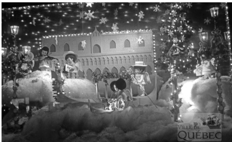
Vitrine du grand magasin Paquet sous le thème « féerie à saveur italienne », vraisemblablement dans les années 1960. (Collection iconographique de la Ville de Québec, cote CI-N410204).

Avant de passer à table, intéressons-nous aux individus eux-mêmes. À quand remonte la présence italienne dans nos contrées? Il semble que les tout premiers individus originaires d'Italie soient arrivés ici en 1665, en tant que soldats du