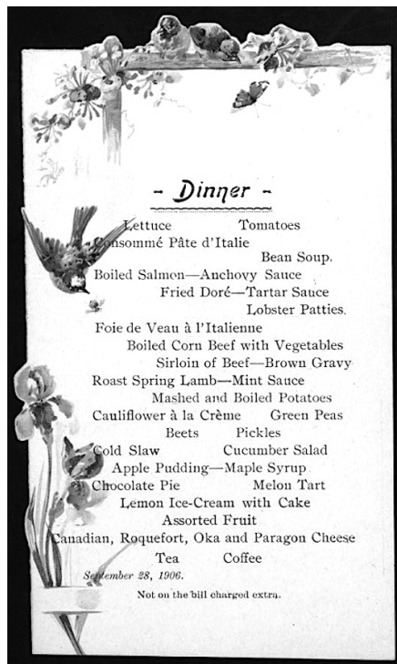
Menu du soir ( dinner ) de l'hôtel Clarendon à Québec, 28 septembre 1906, où apparaissent les mentions « Consommé pâte d'Italie » et « Foie de veau à l'italienne ». Ne nous leurrions pas : la présence de ces mets dits italiens, aux côtés de la surlonge de bœuf et de l'agneau en sauce à la menthe, ne reflète guère plus qu'une volonté d'offrir un menu « européen » à une clientèle touristique anglo-saxonne.

civique, alors que bien des villes créent leur sauce « signature », comme alla bolognese ou napolitaine, des dénominations encore en usage aujourd'hui. Il faut être plus patient avant de voir arriver