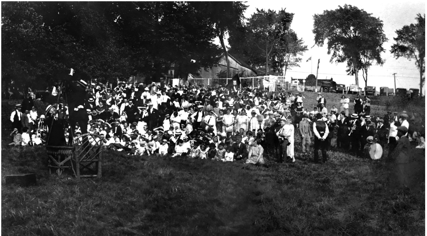
Fête champêtre au parc Jarry.

gie dans l'entre-deux-guerres. D'autres essaient en province, notamment à Black Lake, à Gatineau, à Trois-Rivières et à Québec.