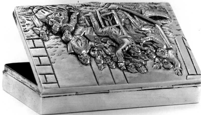
De nombreuses tabatières fabriquées au Canada ont été retrouvées par les archéologues. Celle-ci est ornée d'une représentation festive. Tabatière, 1722. Argent et or, 5,7 x 8,7 x 1,4 cm. Musée national des beaux-arts du Québec, 65.176.