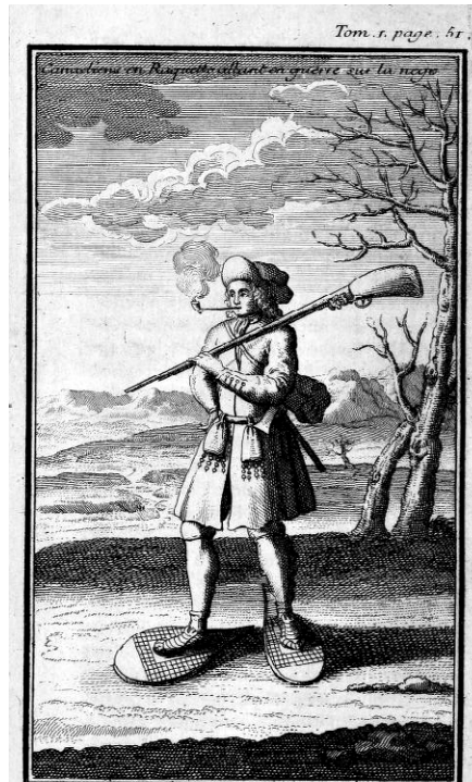
Canadien chaussé de raquettes et fumant la pipe. Illustration tirée de Claude-Charles Bacqueville de La Potherie, Voyage de l'Amérique : contenant ce qui s'est passé de plus remarquable dans l'Amérique septentrionale depuis 1534 jusqu'à présent , Amsterdam, Henry des Bordes, 1723, tome 1, p. 51.

En dépit de cette disponibilité locale, le tabac que préfèrent les habitants du Canada est celui qui vient d'ailleurs... On trouve deux catégories de tabac