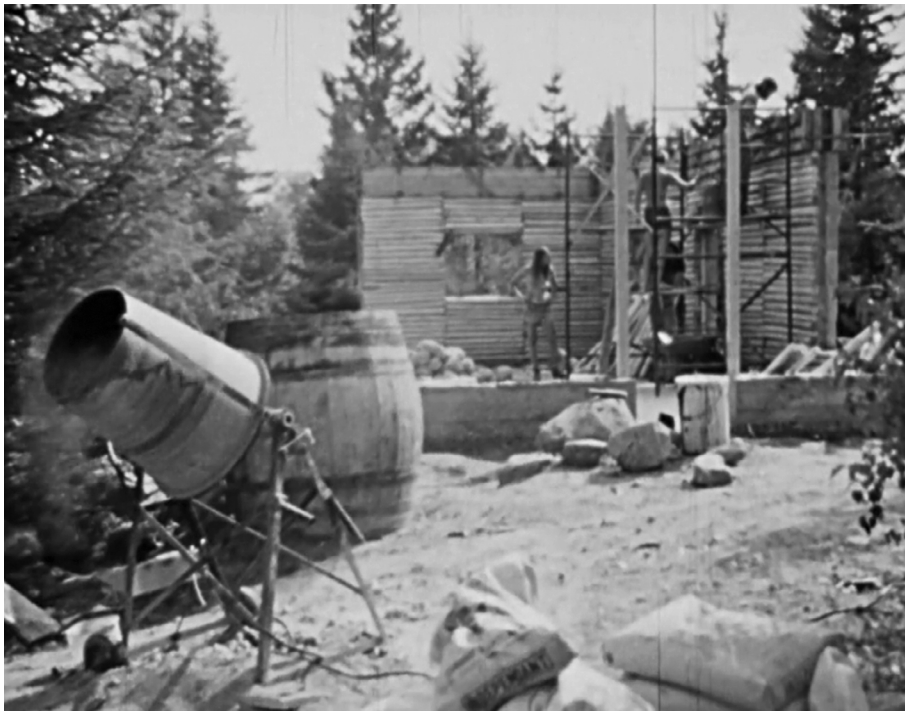
Construction de L'Abri d'Érasme à Sainte-Agathe-des-Monts. (Image tirée du film L'interdit de Pierre Maheu).

ped d'égalité, tous considérés comme des citoyens libres, sujets de volonté comme de désir. En ce sens, réaliser son rêve revenait pour Lemieux à mettre de l'avant les limites de la Révolution tranquille que ce soit en termes de transformation du champ de la santé mentale ou de reconnaissance des droits des personnes atteintes de troubles mentaux (la loi électorale canadienne de 1970 ne leur accordait par exemple toujours pas le droit de vote).