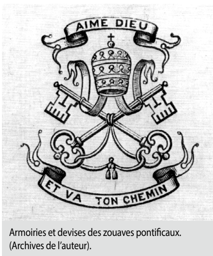
Armoiries et devises des zouaves pontificaux.

Quand les zouaves reviennent au pays, en 1870, après s'être portés volontaires pour la défense des États pontificaux, des fonctionnaires de l'État provincial, les philanthropes et l'archevêché de Montréal croient trouver en eux les candidats parfaits pour jeter les fondements d'une véritable métropole régionale française et chrétienne. En récompense pour leurs actions que l'on dit courageuses (même s'ils ne se sont jamais battus), on offre à quelques-uns d'entre eux des lots de terre dans une paroisse baptisée en l'honneur du pape Pie IX. Au dire de certains, les zouaves canadiens, en associant le courage des militaires et