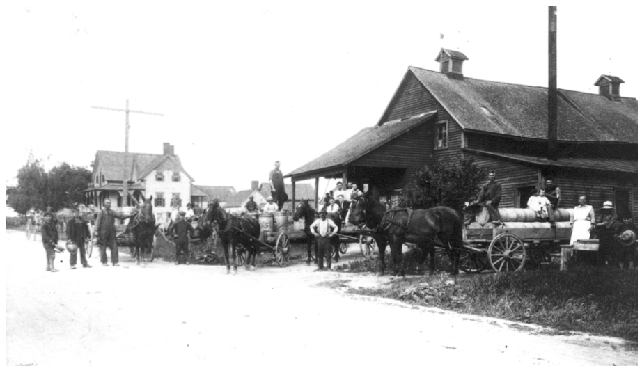
La fromagerie Chapdelaine à Saint-Guilhem, en 1921.

Le mouvement coopératif agricole québécois a connu une forte expansion