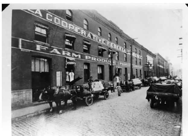
Entrepôt de La Coopérative fédérée, 63, rue William à Montréal, vers le milieu des années 1920. (Archives de Jacques Saint-Pierre).

La période des années 1930 jusqu'à la fin de la Seconde Guerre mondiale est de loin l'âge d'or de la coopération. Les coopératives existantes consolident leur présence et poursuivent leur développement. Par exemple, la Fédération provinciale des unions régionales des