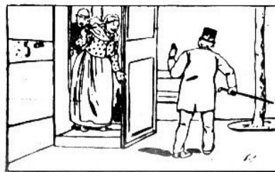
Anon (pantomime d'une poursuite), deux dernières cases, Le Canard , 30 janv. 1897.

n'était comique que dans la mesure où l'inversion de rôles le plaçait à la merci de sa femme. Ce gag classique se retrouve en effet à l'honneur dans les journaux satiriques.