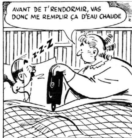
Albert Chartier, « T'aurais pas pu le dire? » (janv. 1946), Onésime , Montréal, La Cie de Publ. Rurale, 1983, p. 20, 3 e , 4 e , 5 e cases. Texte : « Onésime! Vas ( sic ) donc mettre une couple de bûches dans l'poêle! / J viens pas à bout de m'réchauffer. / Avant de t'rendormir, vas ( sic ) donc me remplir ça d'eau chaude. »