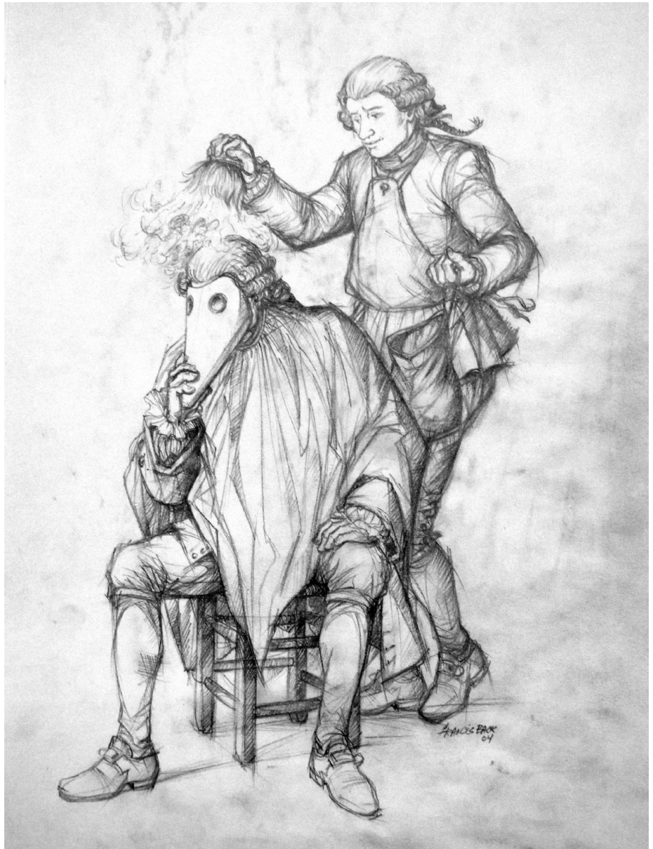
Un coiffeur par Francis Back. (©Raphaëlle & Félix Back).

Une quête identitaire se mêle en partie à ce projet artistique, quête qui l'amène, suivant une démarche empruntant à l'ethnographie, à vouloir mieux saisir les sources originelles qui métissèrent les faits amérindiens et français. Par là, il souhaite également mieux comprendre