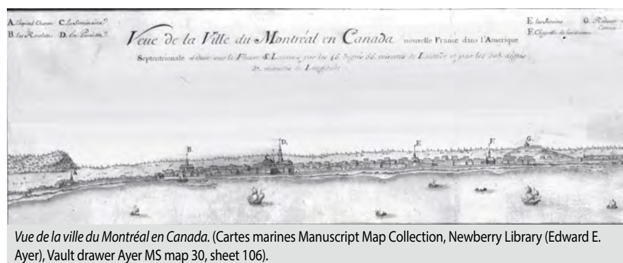
Vue de la ville du Montréal en Canada. (Cartes marines Manuscript Map Collection, Newberry Library (Edward E. Ayer), Vault drawer Ayer MS map 30, sheet 106).