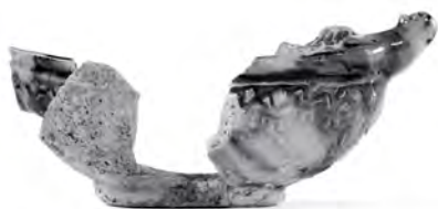
Une navette à encens en terre cuite de Saintonge polychrome, dont les fragments proviennent de différents niveaux de l'occupation du fort de Ville-Marie. (Photo : Luc Bouvrette, Pointe-à-Callière. (101_632_pac_luc_bouvrette.tif)).

Mais les rencontres amorcées par Champlain au début du XVII e siècle changent la donne : la pointe devient un lieu propice aux échanges ne nécessitant qu'un séjour bref, à la belle saison. La présence amérindienne y est dès lors perceptible à travers le mobilier archéologique où se retrouvent aussi des objets européens. Le site aurait ainsi pris une nouvelle connotation, devenant un lieu de