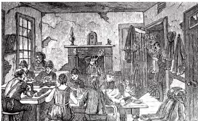
Un sweatshop new-yorkais en 1885. De dos, on voit un homme en manches de chemise et deux femmes décoiffées à cause de l'extrême chaleur qui y règne. À l'arrière-plan droit, un homme repasse des tissus avec un fer à vapeur. Une bouilloire sur le poêle lui prépare du nouveau carburant. Cette gravure, quoique naïve, se veut un témoignage des conditions de travail déplorables des ateliers de misère. ( Third Annual Report of the Bureau of Statistics of Labor, State of New York, 1885 ).