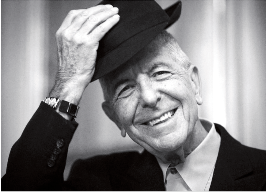
Léonard Cohen soulevant son chapeau pour saluer ses admirateurs à Paris