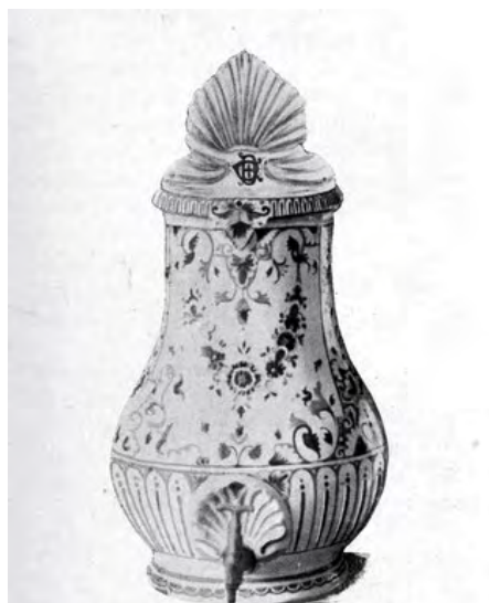
Fontaine emportée de France par Louis Hébert, conservée chez les sœurs du Bon-Pasteur de Québec.