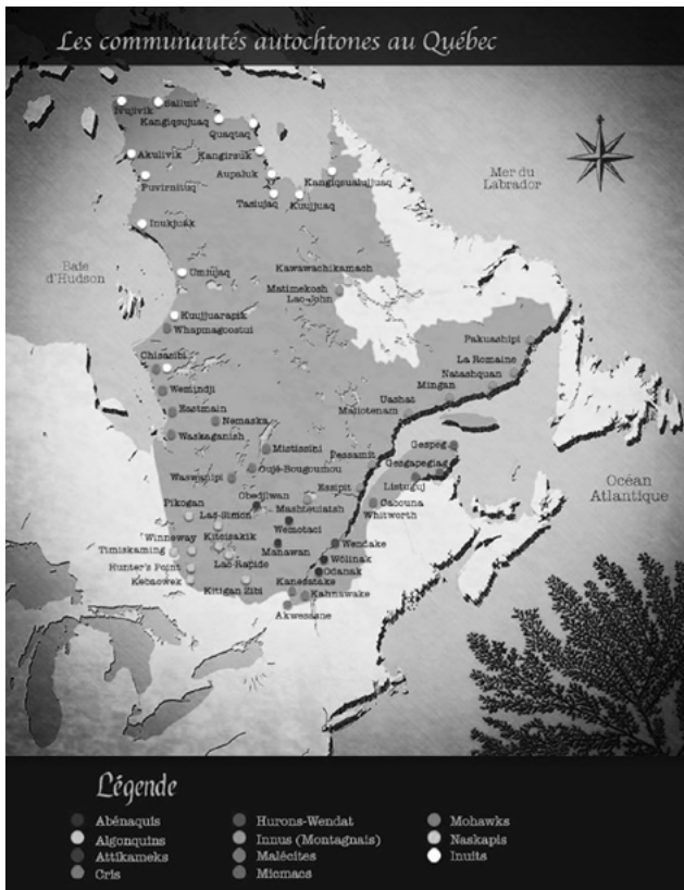
Les communautés autochtones au Québec. Secrétariat aux affaires autochtones du Québec. ( http://www.paricilademocratie.com/approfondir/pouvoirs-et-democratie/1530-pouvoir-et-democratie-depuis-1867 ).