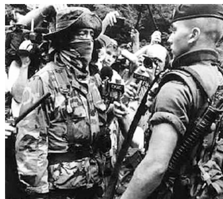
Lors de la crise d'Oka, en 1990, un warrior affronte un soldat du Royal 22 e Régiment sous la surveillance des médias. ( n.wikipedia.org/wiki/Oka_Crisis#/media/File:Oka_lasagna_stare_down.jpg )

Plus récemment, comme nous l'avons mentionné plus haut, deux événements ont marqué l'évolution de la politique autochtone québécoise. Du côté étatique, l'annonce du Plan Nord, en 2011, par le premier ministre de l'époque, Jean Charest, démontre une intention renouvelée de la part du gouvernement de dévelop-