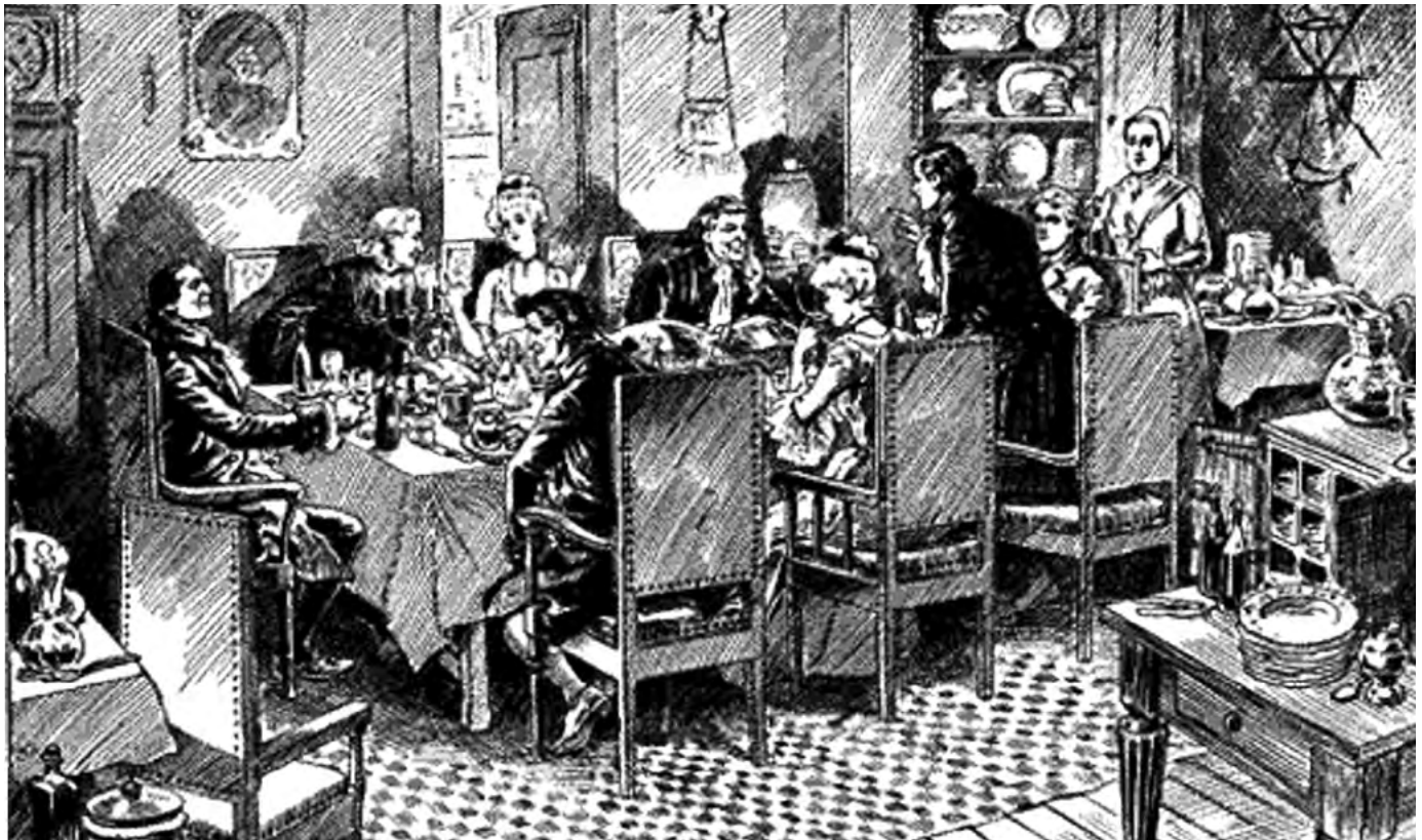
« Un souper chez un grand seigneur canadien au XVIII e siècle », tirée de Henri Julien, Album , Montréal, Librairie Beauchemin limitée, 1916, p. 156. (Bibliothèque et Archives nationales du Québec).

la première moitié du XVIII e siècle caractérisée par une richesse et une population suffisantes pour que se développe une cuisine raffinée (Fournier, 2004). C'est également à ce moment que la Nouvelle-France atteint son paroxysme de maturité avant la Conquête de 1760.