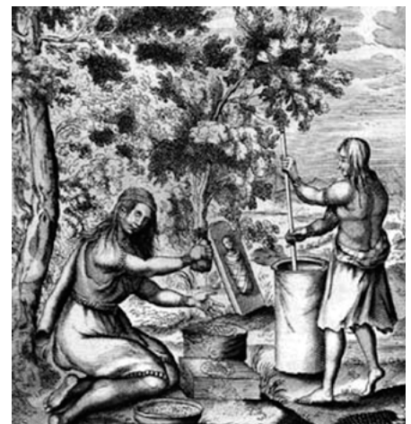
Iroquoises au travail pilant des grains et des fruits secs (gravure de 1664). (François DuCreux. Historiae Canadensis ).

ment par la consommation massive de blé à travers le pain de blé froment. L'élite a poussé plus loin encore ce rapprochement du modèle français en abandonnant progressivement la consommation de viandes de gibier, davantage considérées comme étant des solutions de