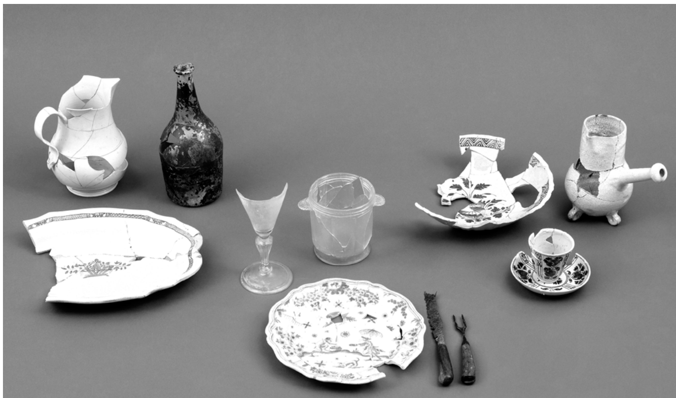
Collections de Place-Royale, Québec. « La table à la française entre 1720 et 1760 ». Réseau Archéo-Québec.

Thomas Wien. « "Les travaux pressants". Calendrier agricole, assolement et productivité au Canada au XVIII e siècle ». Revue d'histoire de l'Amérique française , 43, 4 (1990), p. 535-558.