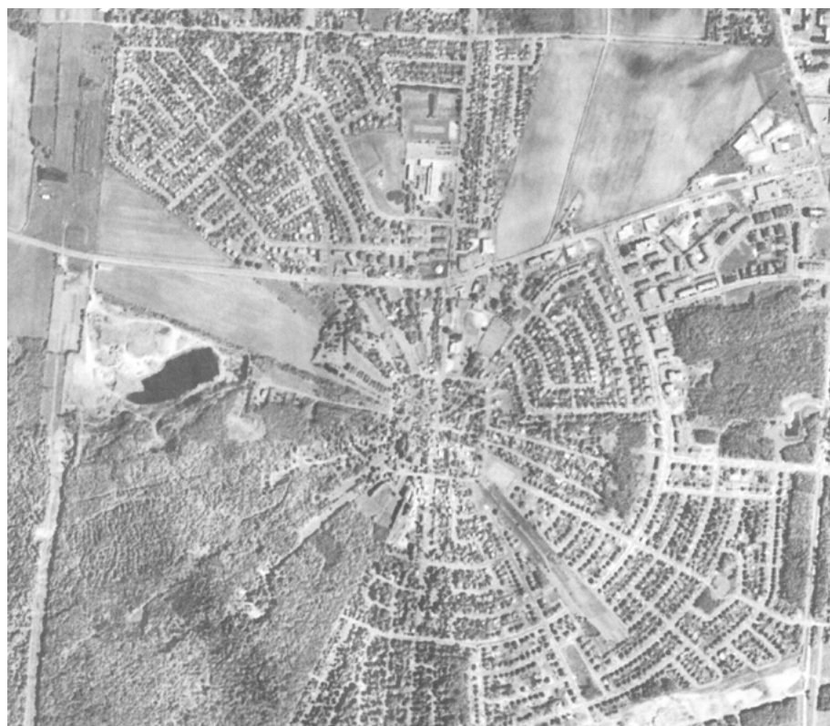
Le trait carré de Charlesbourg aujourd'hui (Google Earth Map).

et des petits commerces s'implantent à travers les maisons de ferme. L'église actuelle est construite en 1830 et le nouveau presbytère en 1875. Le couvent des