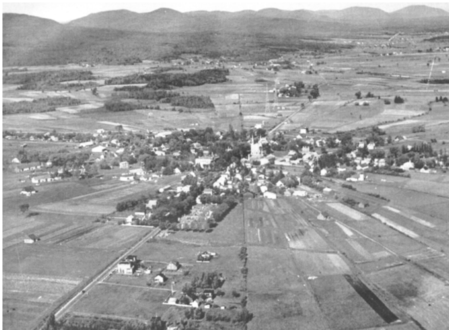
Le trait carré de Charlesbourg. Photographie Edward 1937 (Virtual museum.ca).

sœurs du Bon-Pasteur et le collège des Maristes sont érigés en 1883 et 1903, respectivement. Municipalité de village en 1914, Charlesbourg devient une cité en 1949. Malgré l'urbanisation de la seconde moitié du XX e siècle, le plan radial et le tracé de la commune restent bien visibles dans le paysage. Cet espace d'une grande richesse historique et culturelle est reconnu comme site patrimonial en 1965. Puis, en janvier 2002, Charlesbourg est fusionnée à la Ville de Québec et en devient un des arrondissements.