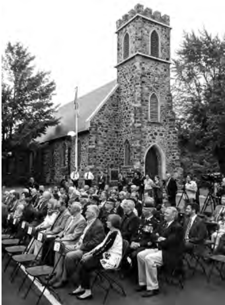
Assemblée des dignitaires drummondvillois lors de l'inauguration de l'Espace Frederick-George-Heriot, le 29 juin 2015, avec l'église anglicane St. George de Drummondville à l'arrière-plan.