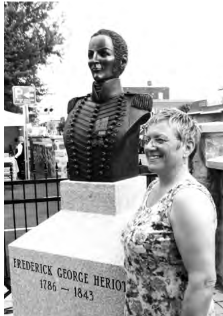
Bronze de Frederick George Heriot avec l'uniforme des officiers du corps des Voltigeurs canadiens. Œuvre de la sculptrice Johanne Lafond, originaire de Saint-Cyrille-de-Wendover.

peindre la fresque colorée des débuts de la colonie de Drummondville. Espérons que les fêtes du 200 e anniversaire susciteront un engouement certain et un intérêt pour notre histoire.