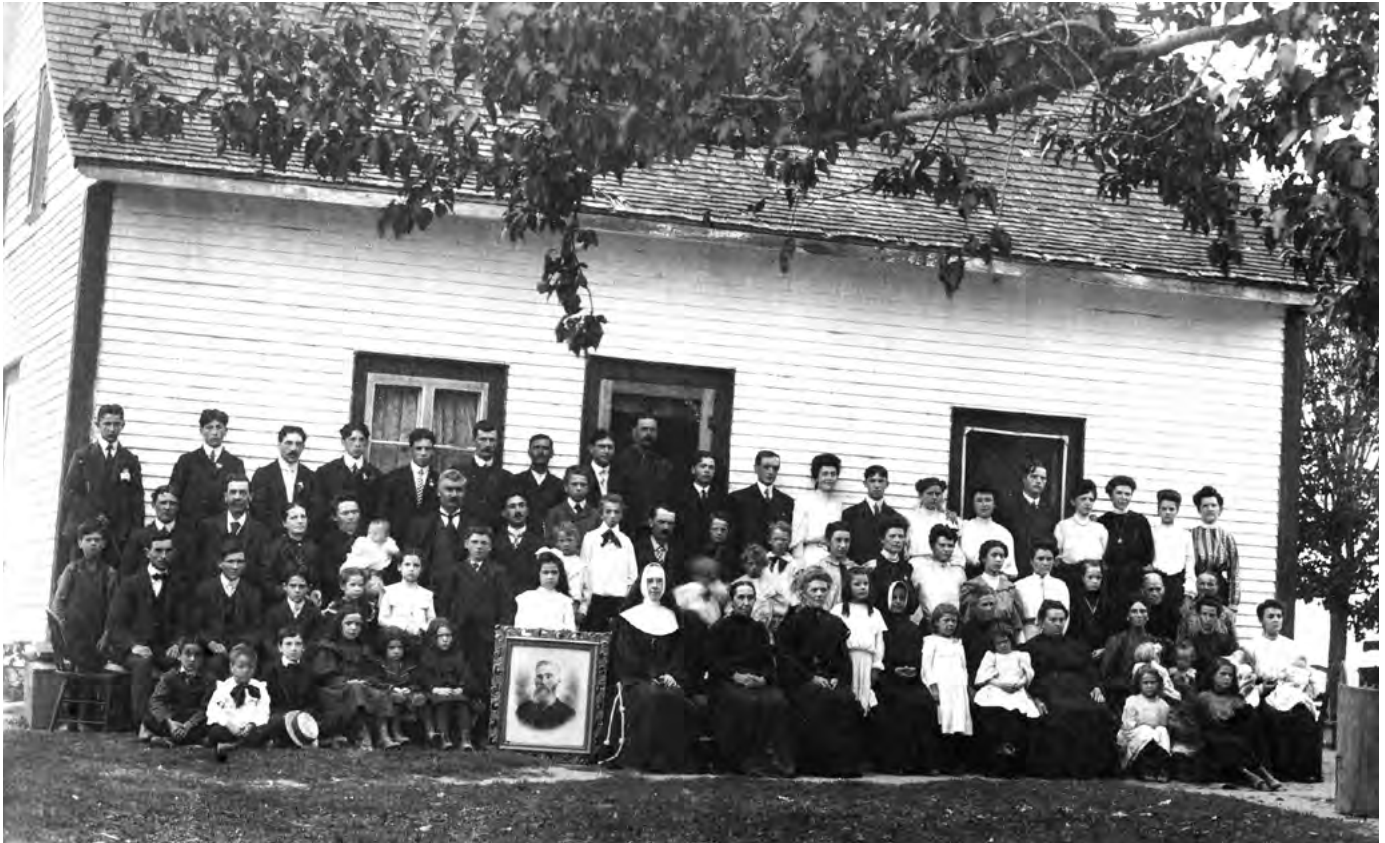
Au décès du fils de l'Irlandais, héros du roman de Georges Dor, toute la famille Dore s'était réunie pour une dernière fois devant la maison paternelle dans le 8 e Rang du canton de Grantham, en octobre 1904.