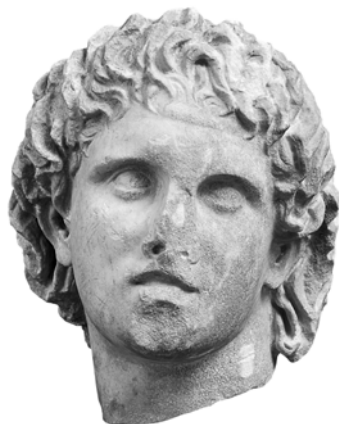
Sculpture en marbre d'Alexandre le Grand. Le jeune homme, devenu maître d'une grande partie du monde antique, a introduit en Asie la culture grecque et a imposé l'usage du grec à de nombreuses populations. Il a aussi fondé pas moins de 70 villes en Orient, sur le modèle des cités grecques. Pella, fin du IV e siècle avant notre ère. Musée archéologique de Pella.

Après Pointe-à-Callière (Montréal), la tournée nord-américaine de l'exposition Les Grecs - D'Agamemnon à Alexandre le Grand se poursuit.