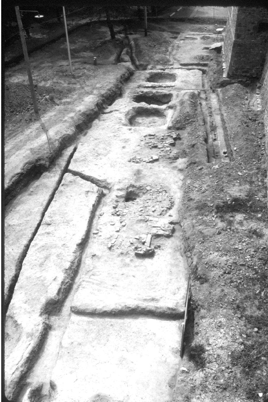
Vue vers l'ouest d'une partie des vestiges associés au premier fort Chambly. Les palissades suivaient le tracé des petites tranchées qui témoignent d'une section de courtine et d'un redan. On aperçoit également les caves et les bases de cheminées des bâtiments qui longeaient la courtine sud. (Parcs Canada).