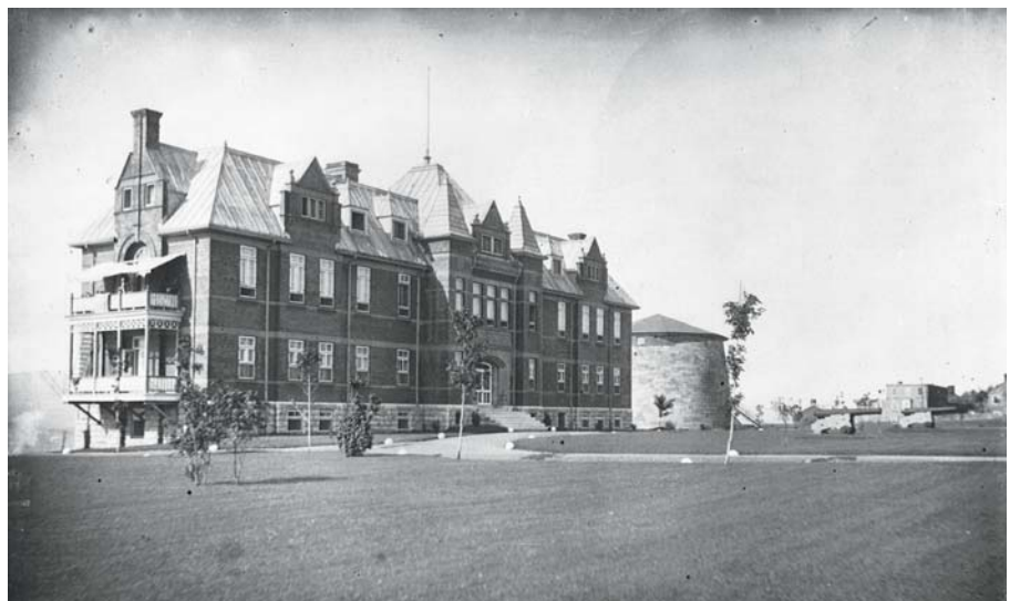
Le deuxième hôpital Jeffery Hale en 1904, peu avant la démolition de la tour Martello 3 pour construire le McKenzie Memorial Building.

Le Jeffery Hale croît rapidement. Des ailes pour contagieux et pour enfants sont ajoutées. Avec la fermeture de l'Hôpital de la Marine, en 1891, le Jeffery Hale reçoit les marins et les immigrants protestants. Vers la fin du siècle, les patients sont plutôt entassés. L'hôpital reçoit un don important lui permettant de déménager dans de nouveaux locaux.