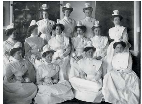
Classe d'infirmières de 1911 à l'hôpital Jeffery Hale. Entre 1901 et 1970, l'hôpital gère la première école des sciences infirmières à Québec. 1 285 infirmières y obtiennent leur diplôme.

l'offre en anglais au Jeffery Hale. En 1982, le gouvernement ordonne la fermeture des services d'urgence et de pédiatrie à l'hôpital. Les anglophones se mobilisent, une pétition est lancée et le gouvernement revient sur sa décision. Dans les années 1990, la Régie régionale de la santé décide de transformer le Jeffery Hale en centre de soins de longue durée. Les anglophones se mobilisent encore et certains services hospitaliers sont maintenus, notamment les services d'urgence, mais la chirurgie et l'obstétrique sont abandonnées. En 2000, on tente encore de faire disparaître le Jeffery Hale à travers un énième projet de consolidation régionale. La communauté anglophone négocie plutôt en vue d'une consolidation des institutions sur une base linguistique. Les institutions anglophones de santé et de services sociaux à Québec sont regroupées, dont le Saint Brigid's Home fondé par les Irlandais, en 1856. Une minorité infime d'irlando-catholiques n'aime pas l'idée de fusion avec les « protestants », mais la majorité des