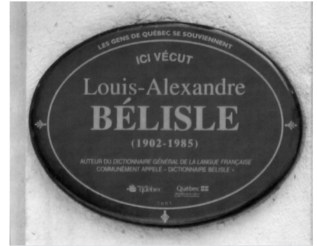
Épigraphie installée par la Ville de Québec au 801, avenue Murray. (La Cité-Limoilou) Québec.

reprise chez Beauchemin, puis aux Édition Aries. Une troisième édition grand format paraîtra en 1971, puis une dernière en 1979, chez Beauchemin. Le Dictionnaire rapportera à son auteur plusieurs honneurs : lauréat du Prix de la langue française de l'Académie française en 1958, puis de la médaille d'or