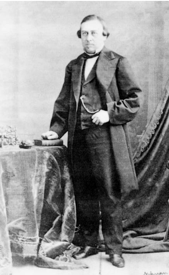
Hector Langevin (1826-1906), avocat, journaliste et homme politique. Langevin va participer aux trois conférences préparatoires à la Confédération.

En effet, Cartier devait faire face au problème de l'existence d'identités culturelles diverses au sein des colonies britanniques. Sa solution fut donc d'articuler une théorie fédérative adaptée à la réalité socioculturelle et politique canadienne, soit une théorie basée principalement sur la double idée d'identités culturelles diverses et d'une nationalité politique commune.