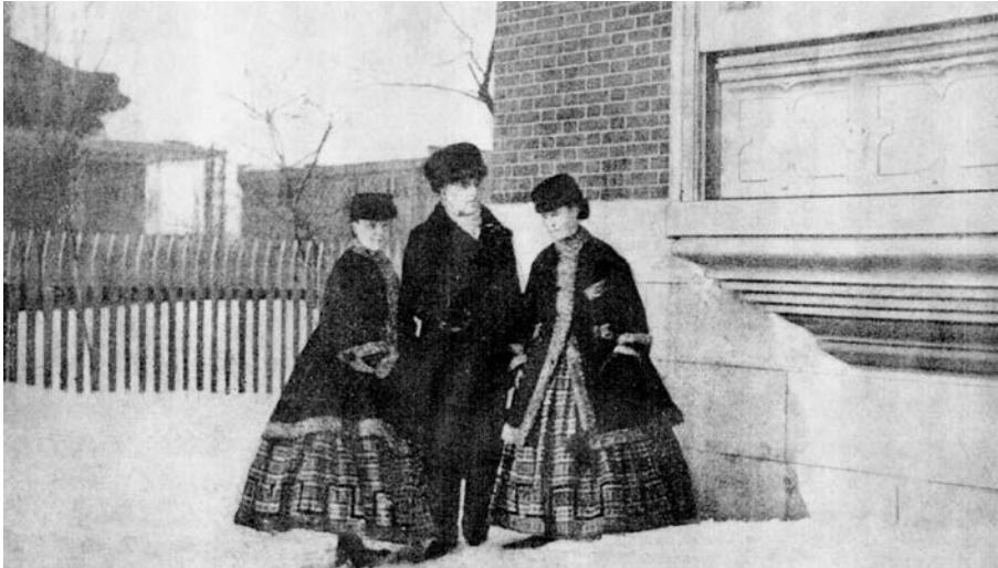
Carte postale (Série centenaire Cartier, 1914) montrant George-Étienne Cartier et ses deux filles, en 1863. (Banque d'images de Cap-aux-Diamants ).

etc.) puissent être régies différemment dans chacune des deux sections.