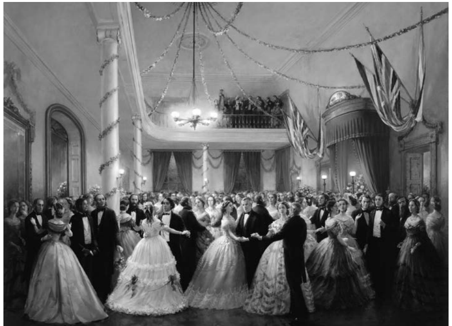
Bal public et banquet à Province House, Charlottetown, septembre 1864, par Dusan Kadlec. Cette représentation fidèle de la mode vestimentaire et des bals de l'époque évoque deux des trois grandes activités mondaines qui se sont déroulées dans l'édifice du parlement du Canada-Uni, en octobre 1864. (Photographie courtoisie de Dusan Kadlec et de l'Agence Parcs Canada).

Finalement, s'ajoutent les repas que le gouverneur général réserve à de petits groupes d'invités à son domicile de Spencer Wood ainsi qu'au parlement. Finalement, ces activités à caractère privé et convivial, dont il n'existe qu'un inventaire partiel et des descriptions sommaires, laissent entrevoir des jeux de coulisses inhérents à tout rassemblement de nature politique. Les sources ne permettent pas toutefois d'en mesurer l'effet sur les rapports qui se tissent entre les convives (délégués, représentants de la couronne, représen-