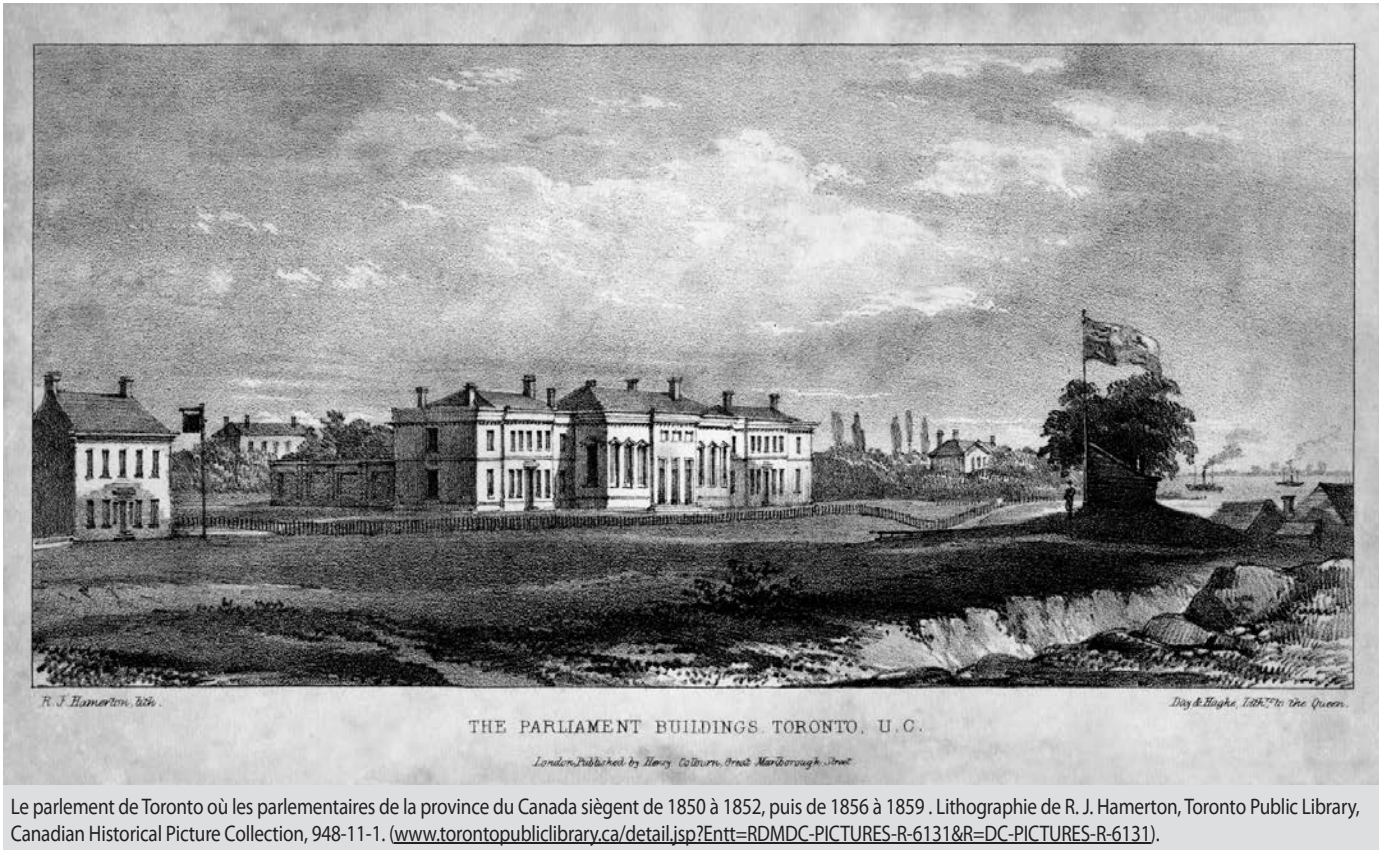
Le parlement de Toronto où les parlementaires de la province du Canada siègent de 1850 à 1852, puis de 1856 à 1859. Lithographie de R. J. Hamerton, Toronto Public Library, Canadian Historical Picture Collection, 948-11-1. ( www.torontopubliclibrary.ca/detail.jsp?Entt=RDMD-PICTURES-R-6131&R=DC-PICTURES-R-6131 ).

Quelques semaines plus tard, Galt fait son entrée au cabinet Cartier-Macdonald à titre de trésorier, à la condition que son projet de confédération soit accepté par le gouvernement. Le 7 août 1858, George-Étienne Cartier annonce que son gouvernement communiquera avec Londres et les autres provinces canadiennes pour mettre en branle ce projet.